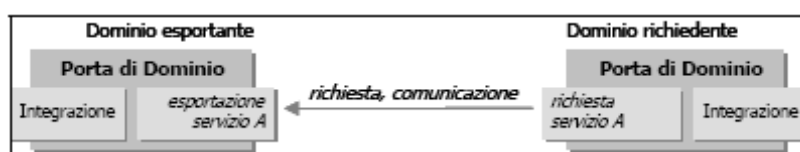
Fig 3.1 Collaborazione One Way

Nel caso di collaborazione MessaggioSingoloOneWay, come rappresentato in figura 3.1, la Porta di Dominio mittente invia un messaggio alla Porta di Dominio destinataria ma non resta in attesa di alcuna risposta. In figura 3.2 è riportata come esempio la header del relativo messaggio SOAP.