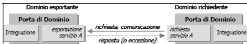
Fig 3.3 Cooperazione per richiesta di servizio sincrona

In figura 3.4 è riportata la header del messaggio SOAP contenente la richiesta, mentre in figura 3.5 è riportata la header del messaggio contenente la risposta applicativa.